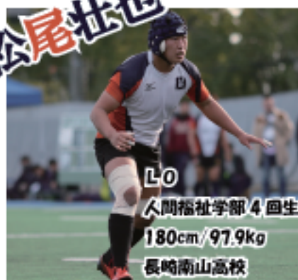
LO 人間福祉学部4回生 180cm/97.9kg 長崎南山高校