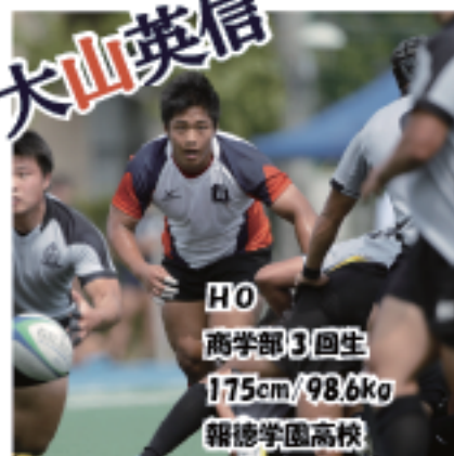
HO 商学部3回生 175cm/98.6kg 報徳学園高校