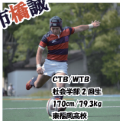
CTB/WTB 社会学部2回生 170cm/79.3kg 東福岡高校